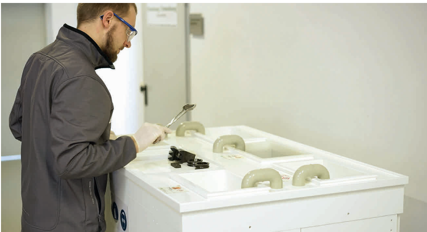
1 Mobile Ätzeinrichtung für das Nital-Ätzverfahren